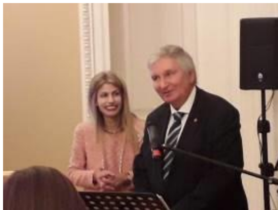
Ο Έλληνας πρέσβυς στη Μόσχα Ανδρέας Φρυγανάς Κάρποβ