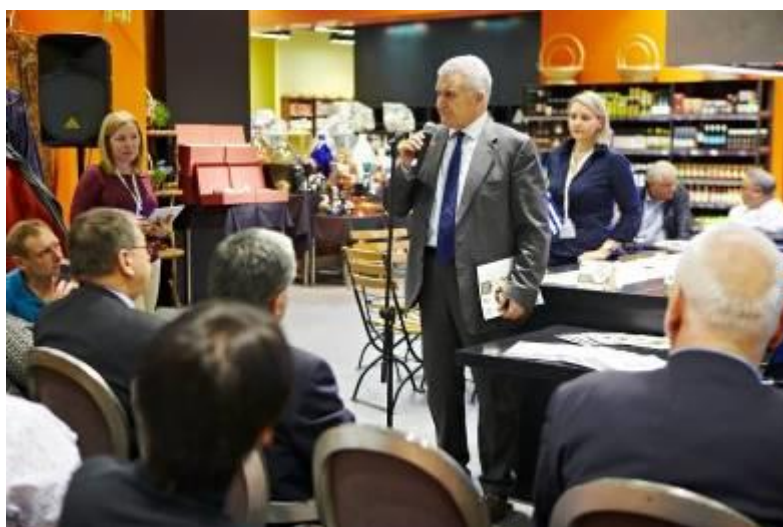
Ha photo: Димитрис Βελανις / Δημήτρης Βελάνης

Πρόκειται για ένα υποστηριζόμενο από την ΕΕ 3ετές πρόγραμμα προώθησης στη Ρωσία, σε στοχευμένο κοινό, της ελληνικής ελιάς. Σύμφωνα με αναλυτές της αγοράς, το πρόγραμμα ξεκίνησε με επιτυχία, μέσα σε σύντομο χρονικό διάστημα απέδωσε εντυπωσιακά